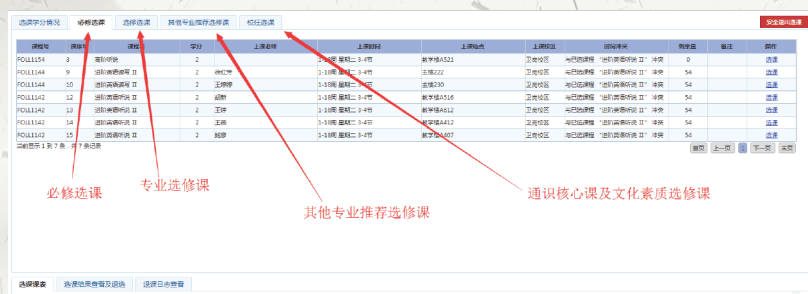
图七：课程信息显示