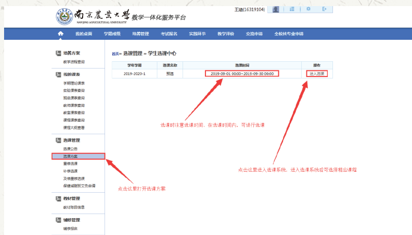
图六：学生选课中心界面

(1) 进入“学生选课中心”后，点击左侧的 选课方案 进入选课显示的阶段，点击“进入选课”，即出现选课界面，如图六和图七：窗口左侧区域显示备选课程信息。“校任选课”显示“通识教育核心课程”和“文化素质选修课”的所有备选课程。