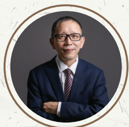
何 军 教授