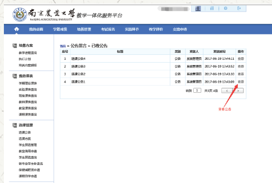
图五: 选课公告模板

点击“学生选课中心”, 显示“选课公告”, 如图五: “选课公告”将显示关于选课的通知、要求等信息, 学生必须在选课前仔细阅读。选课、退课及课表查询可以通过点击左侧菜单进行。“选课方案”中列出所有备选课程, 供学生自主选择。