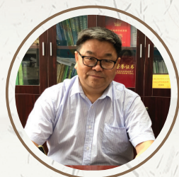
洪德林 教授 江苏省教学名师 南京农业大学钟山教学名师