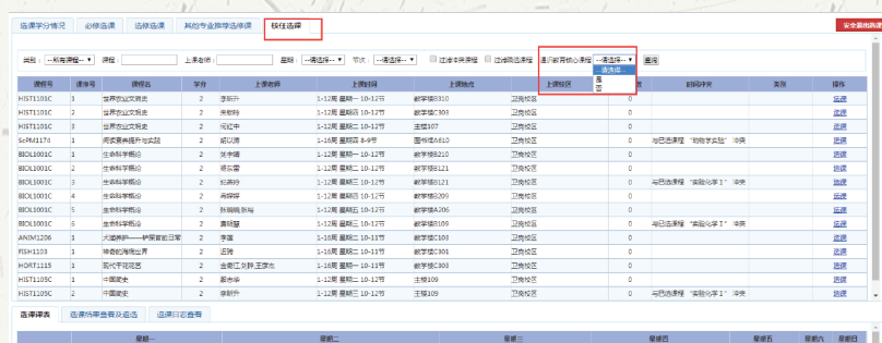
图八：选课界面(校任选课)

找到自己需要选择的课程，点击课程后面的“选课”，确定选课系统会提示选课成功或由于选课冲突不成功，请注意查看弹出的提示信息，选择成功后，下面的“选课课表”会显示已选择的课程课表。