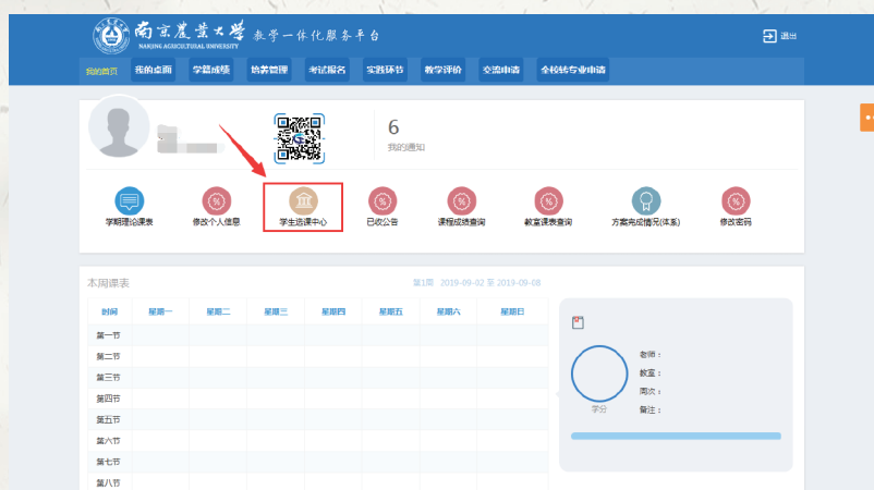
图四: 教学一体化服务平台主界面

如图四: 窗口左方会显示你的姓名, 选课结束, 必须点击右上角“退出”, 退出系统, 然后点击校园信息门户主页右上方的“退出登录”, 退出校园信息门户, 否则选课结果可能会因他人继续使用电脑而出现错误。所有选课及课表查询工作均可点击教学一体化服务平台“学生选课中心”进行, 如图四。