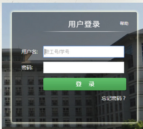
图一: 校园信息门户登录

学生访问校园门户系统主页: http://my.njau.edu.cn , 在用户名、密码输入框中分别输入用户名(学生的用户名是学号)与密码(初始密码为身份证后六位), 然后点击登录按钮。学生登录密码如有疑问,请与信息化建设中心联系(理科实验楼南楼一楼网络信息服务大厅,电话: 84396018)。