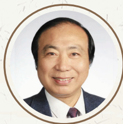
陶思炎(东南大学教授) 中央文史研究馆馆员,江苏省文联副主席