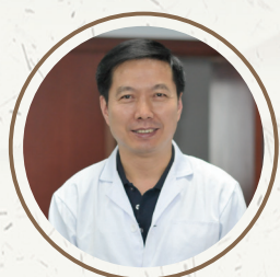
洪晓月 教授 江苏省教学名师 南京农业大学钟山教学名师