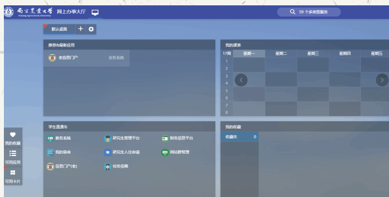
图三: 校园信息门户主界面

学生进入校园信息门户主界面,如图三: 点击“教务系统”即可进入教学一体化服务平台。